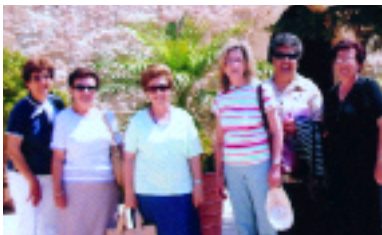
Μέλη του Σ.Α.Φ.Ε Κύπρου στον Άγιο Ραφαήλ Αμμοχώστου.

Η πρώτη συνάντηση έγινε στο πάρκο Ακροπόλεως, όπου μέσα σε ένα ειδικό περιβάλλον πήραμε το πρωινό καφέ μας, μιλήσαμε και προγραμματίσαμε τις δραστηριότητες της χρονιάς. Έγιναν εισηγήσεις για το που και πως θα προσφέρουμε τη βοήθειά μας-πάντοτε στους τομείς της εκπαίδευσης και του πολιτισμού.