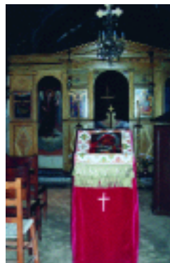
Από το εσωτερικό της εκκλησίας.