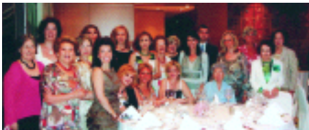
Η Πρόεδρος και τα μέλη του Συνδέσμου στο Galaxy.

Μια ωραία καλοκαιρινή βράδια απολαύσαμε τα μέλη και οι φίλες του Σ.Α.Φ.Ε. στις 18 Ιουνίου στο Galaxy του ξενοδοχείου Hilton. Σε ευχάριστη ατμόσφαιρα χαρήκαμε τη μοναδική θέα της φωτισμένης Αθήνας και