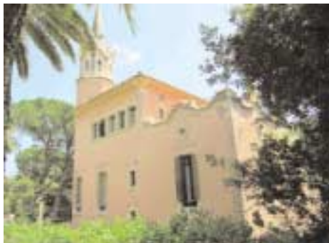
Το σπίτι-μουσείο Γκαουντί.

Συνεχίσαμε για το Μουσείο Πικάσο (1881-1973), που περιλαμβάνει πολλά έργα του: πίνα-