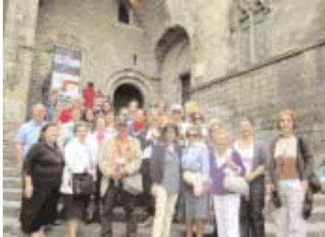
Στο Μουσείο Πικάσο

μία όμορφη πόλη με ωραίες φαρδιές λεωφόρους, που σου δίνει την αίσθηση άνεσης χώρου, γιατί στις διασταυρώσεις δεν υπάρχουν γωνίες (όλα τα σπίτια έχουν κομμένη τη γωνία).