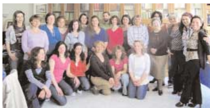
Στιγμιότυπα από τη συνάντησή μας με το 3ο Δημοτικό Σχολείο Κόνιτσας.