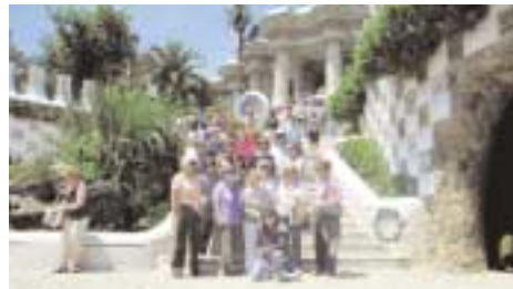
Στο Πάρκο Γκουέλ. Στο βάθος διακρίνονται οι κολόνες που στηρίζεται η Γκραν Πλάσα.

Η εκδρομή μας συνεχίστηκε προς το Φιγκέρρες (Figueres), όπου γεννήθηκε και πέθανε ο Salvador Dali (1904-1989). Το 1974 ο Νταλί με-