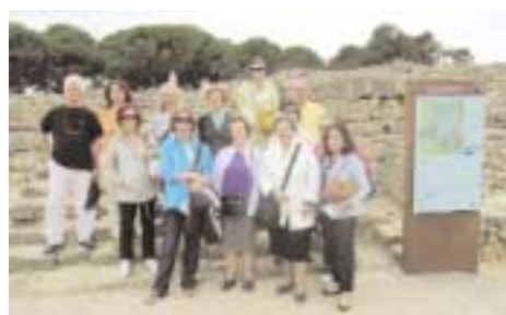
Στον Αρχαιολογικό χώρο της ελληνορωμαϊκής πόλης Εμπόριο.

τέτρεψε το Θέατρο της πόλης σε Μουσείο S.Dali . Περιλαμβάνει τεράστιο αριθμό έργων του εκκεντρικού αυτού Καταλανού καλλιτέχνη που ξάφνιαζε πάντοτε τον κόσμο με τα δημιουργήματά του μέχρι το θάνατό του και έχει καθιερωθεί ως ένας από τους μεγαλύτερους