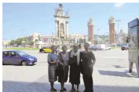
Η Πλάσα ντ' Εσπάνια έξω από το ξενοδοχείο μας.

Το πρόγραμμά της δεύτερης μέρας τελείωσε με την επίσκεψη στην πόλη Χιρόνα (Girona), όμορφη μεσαιωνική πόλη που τα σπίτια της με τα ζεστά γήινα χρώματα καθρεφτίζονται μέσα στο ποτάμι. Πόλη όπου έζησαν πολλοί Εβραίοι