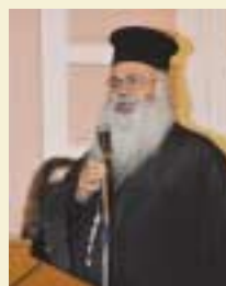
Ο Μητροπολίτης Πάφου.