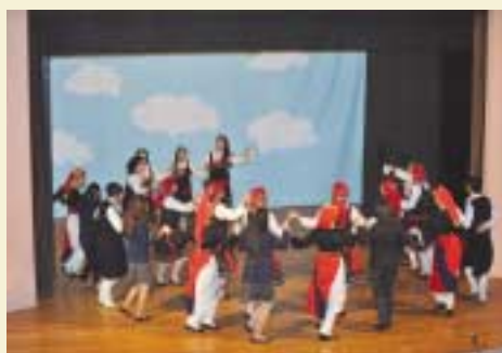
Ελληνικοί χοροί από μαθήτριες του Αρσακείου.

τα 200 χρόνια ιστορία τους σχολείου τους, τα οποία γιορτάζουν φρέτος, Θεατρικό Αναλόγιο και παραδοσιακά ελληνικά και κυπριακά τραγούδια. Οι μαθητές του Αρσακείου Γενικού Λυκείου απήγγειλαν αποσπάσματα από το έργο του νομπελίστα ποιητή Γιώργου Σεφέρη «Κύπρον, ου μέθέσπισεν», τραγούδησαν παραδοσιακά κυπριακά τραγούδια με τον Όμιλο Βυζαντινής Μουσικής και χόρεψαν παραδοσιακούς ελληνικούς και κυπριακούς χορούς.