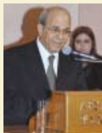
Ο Πρέσβης της Κύπρου κ. Ιωσήφ Ιωσήφ.