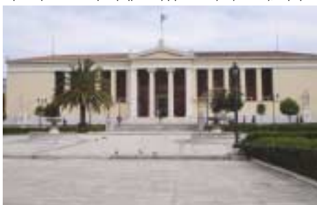
Το Πανεπιστήμιο Αθηνών

Τώρα λοιπόν καλούμεθα να ζήσουμε με «τρεις και ε-ξήντα» όπως λέγαμε παλιά, προφητικά άραγε; Τότε που δεν ξέραμε πως το επίδομα ανεργίας θα κατοχυρωνόταν στα 360 ευρώ καθαρά. Τώρα αναζητούμε άλλα μέτρα και αξίες. Τώρα πάμε «εμπρός πίσω». Γυρίζουμε στην οικογένεια, ανακαλύπτουμε το κυριακάτικο φαγητό στο σπίτι, αλλά και τις καθημερινές νοστιμιές της κουζίνας μας, αρκούμαστε σε μετρημένες βραδινές εξόδους, αγορά-