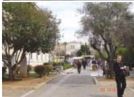
Η άλλη όψη του Πανεπιστημίου