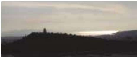
Από τον Ιερό Βράχο της Ακροπόλεως δειλινό με θέα του Φιλοπάππου και στο βάθος ο Σαρωνικός