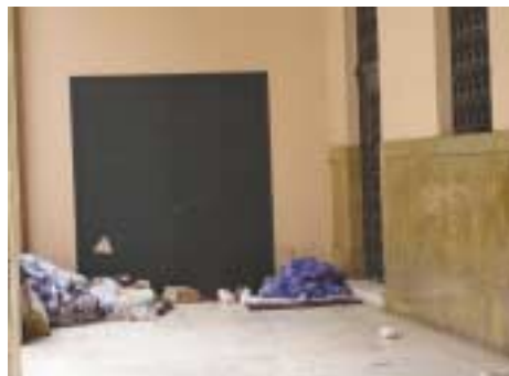
Έξω από τη Νομική Σχολή Αθηνών